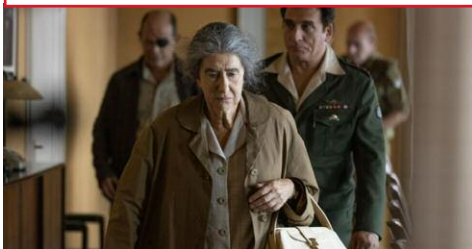
► Golda – Israels Eiserne Lady

► Kinostar Arthaus-Kinos Heilbronn ab 30. Mai