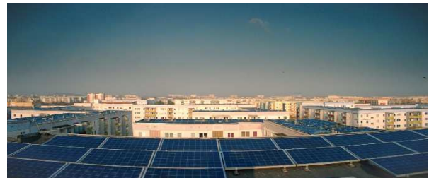
Plattenbauten im Gelben Viertel in Berlin