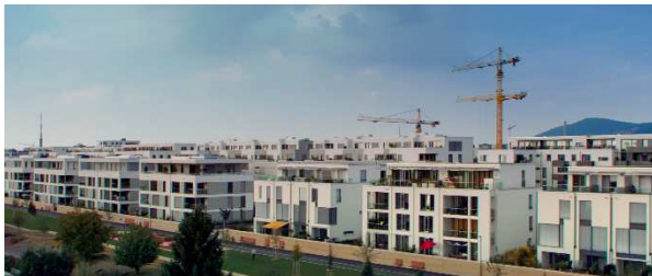
Die Passivhaussiedlung „Bahnstadt“ in Heidelberg

Der Film schließt mit der Hervorhebung des entscheidenden Fehlers aktueller Energiepolitik, nämlich deren Halbherzigkeit, manifestiert im Nebeneinander von konventioneller und neuer Energiepolitik! Auf diese Weise kann die Energiewende nicht effektiv wirken, denn – so das Fazit des Films – nur die Summe aller Veränderungen führt zum Erfolg!