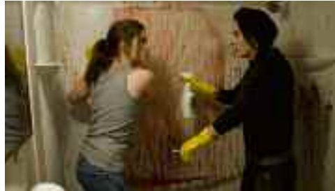
♦ Sunshine Cleaning