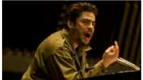
► Che - Revolucion (Teil 1)

► Universum Arthaus-Kinos Heilbronn ab 11. Juni 2009